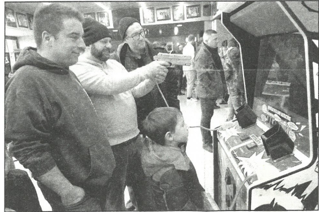
Les nombreuses bornes d'arcade ont permis aux visiteurs de s'amuser