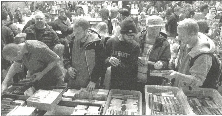
1430 visiteurs se sont pressés autour des tables à la recherche de la pièce rare

Estavayer-le-Lac Samedi dernier, la 3 e édition de RetroMania a connu un immense succès