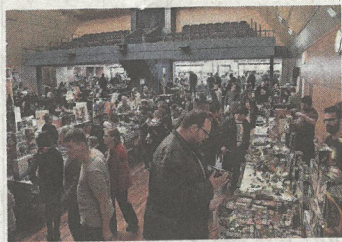
En 2017 la 1 re édition de Retromania avait attiré la foule.